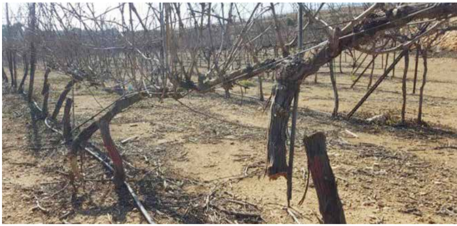
הגבנים שהושחתו.