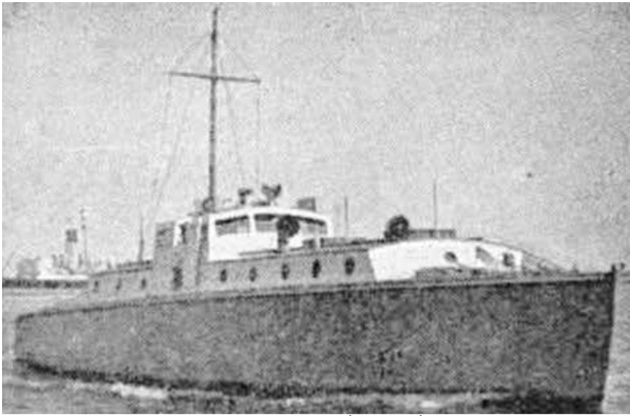
"ארי הים" SEA LION הסירה שהובילה את הכ"ג למשימתם