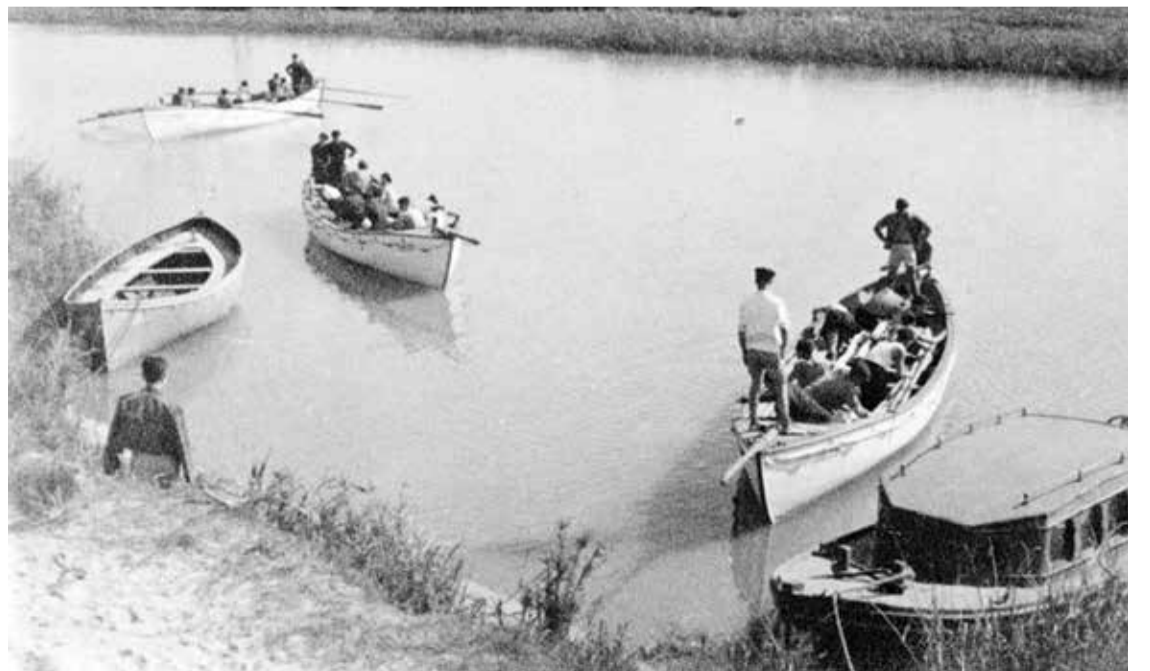
קורס ימי של הכ"ג מתחילת 1941, ליד שפך הירקון

ל"שיתוף" עם הבריטים. בפגישה השלישית כבר צורף קולונל מהצי הבריטי. לקורס הימי שנפתח ב-1 בינואר 1941 וארך כארבעה חודשים השתתפו 16 ימאים ותיקים מהקורסים הקודמים, ו-16 מתנדבים חדשים - עשרה מהקיבוץ המאוחד, אחד מהק"י בוץ הארצי וחמישה עירוניים. שישה ממשתתפי הקורס נשלחו לסייע לב-ריטים ביוון ופוצצו גשר מעל תעלת קורינתוס, כדי לעכב את כיבוש יוון על ידי הגרמנים. הם חזרו משם לאחר שהכ"ג כבר יצאו לטריפולי. אל 26-