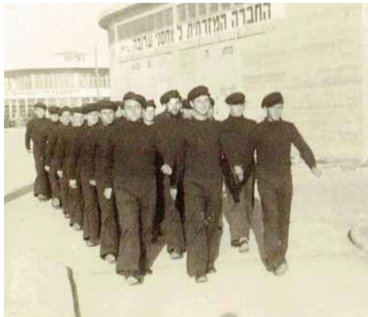
משתתפי הקורס הימי במדים כחולים

במבצעים חשובים ביותר בהתפתחות המלחמה". גלילי נוף בשדה קשות על "ההחלטה הבלתי שקולה והבלתי אחראית ואם לא יבטלה אתבע שינוי ההחלטה על ידי מוסר מוסמך". בע" קבות זאת, שדה ביטל את התכנית להצטרפותו לפעולה. למרות הסוריות הגבוהה שאפפה אותה, הסתננה הירי" עה עליה ליגאל אלון ולמשה דיין והם פנו ליצחק שדה שיצרפם. שדה דחה את בקשתם ועל פי עדותו של אלון אמר להם שיש שם מספיק אנשים, ימאים ולוחמים ומפקדים כצבי ספק" טור וכתריאל יפה. זמן קצר אחר כך הטיל עליהם יצחק שדה להיות למפ"