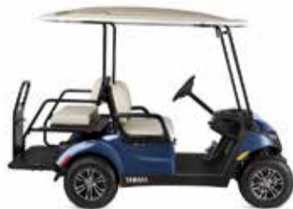
רכבים תפעוליים בנזין/ חשמלי