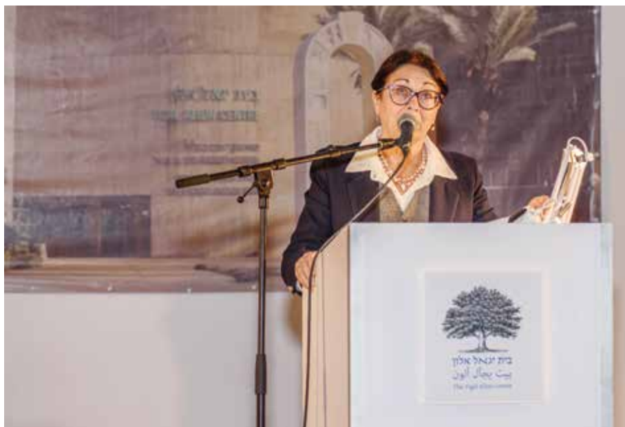
נשיאת בית המשפט העליון השופטת אסתר חיות בכנס

כבר לא ראשוניים. כבר לא תמיד. כבר לא אנחנו.