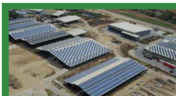
עלומים - 1.5 מגה-וואט