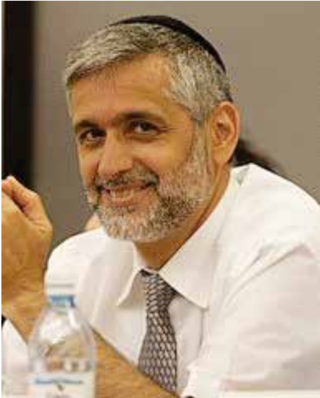
אלי ישי. "רוב אזרחי ישראל, אם לא כולם, חושבים כמוני"