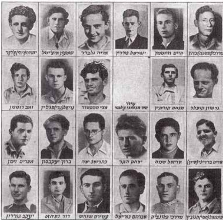
פרסום תמונותיהם של הכ"ג שמורסם בעיתונות בארץ ישראל ב-17 במאי 1946