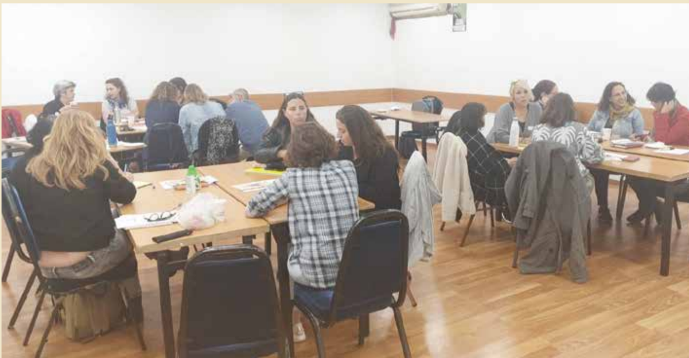
קורס רכזי תרבות בשבוע שעבר