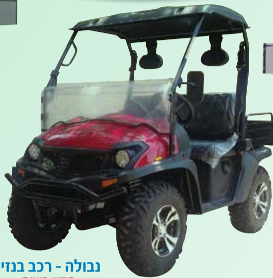
נבולה - רכב נדון חדש בשוק