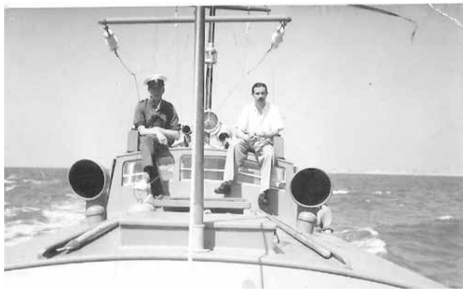
"ארי הים" כשהייתה עדיין ברשות המשטרה הבריטית