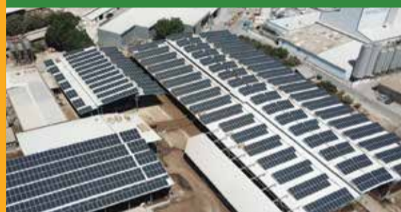
גניגר - 690 קילו-וואט