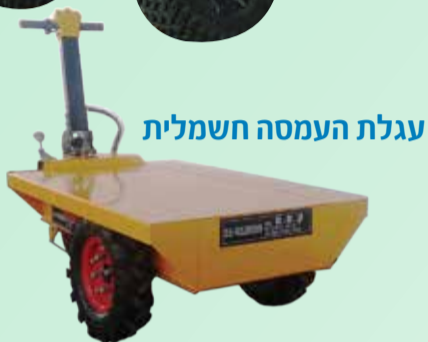
עגלת העמסה חשמלית