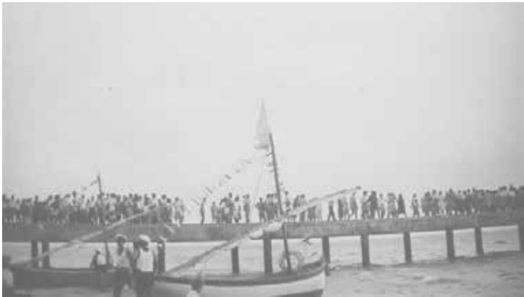
תושבי כפר ויתקין על המזח ב"יום הים" (1946)

רנו בים בגאווה על 'הדיל' הבלתי רגיל שעשינו. כולם שמעו בקנאה. מה לעשות. חלון הזדמנויות נפתח רק פעם אחת!