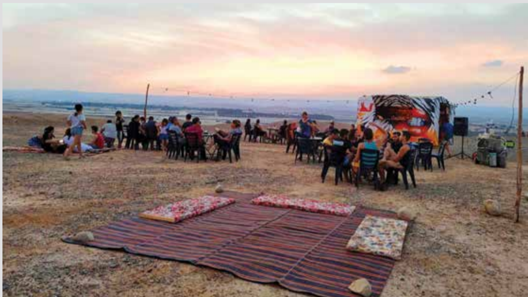
ה-MID-BAR בר על גלגלים המסייר בערבה