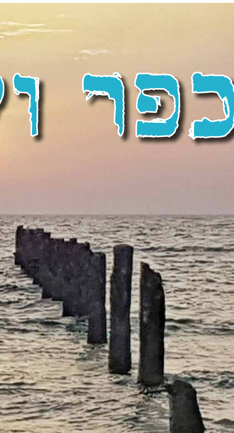
המזח בבית ינאי - מרץ 2018

פעם, עוד בשנים שלפני קום המדינה, היה לכפר-ויתקין חוף ים משלו. מה זוכר ילד קטן מאותם ימים רחוקים? מתברר שדי הרבה מדרשי בר כוכבא נזכר בילדותו, על "חוף כפר ויתקין", מימי שלטון הבריטים בארץ-ישראל ועד ימינו