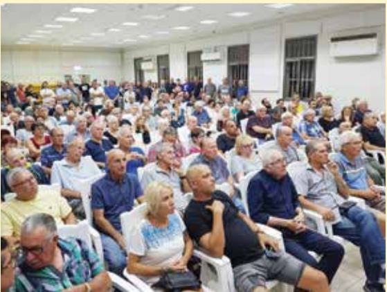
כנס תמיכה במפלגת "צומת" בכפר סירקין

"איננו עוסקים בוויכוח שבין הימין לשמאל. הדבר היחיד שניצב לנגד עינינו הוא דאגה לחקלאים ומתיישבים, שננטשו על ידי המדינה וזכויות היסוד שלהם נרמסות מדי יום. זוהי מלחמה על הבית ועל עתיד ההתיישבות והחקלאות במדינה. במושבים חיים כ-350 אלף בעלי זכות בחירה, המהווים בין 8 ל-10 מנדטים. אני משוכנע שנהיה הפתעת הבחירות ולכל הפחות נביא 5 מנדטים."