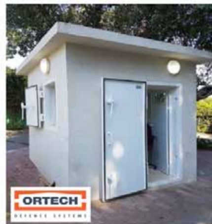
ביתן שומר ממוגן בטון

קבוץ כרמיה | 08-6749781 | www.ortechisrael.co.il