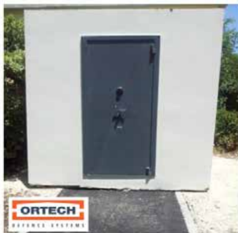
חדר נשק לפי תקן מ"י