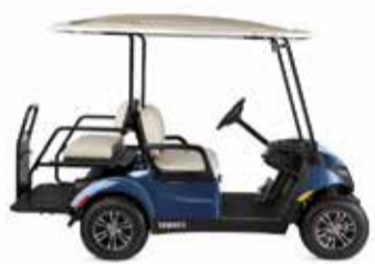
רכבים תפעוליים בנזין/ חשמלי