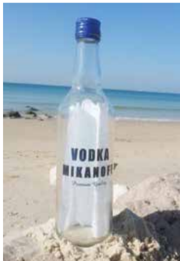
בקבוק הוודקה עם מכתב הימאים הרוסיים שנפלט לחוף

בחוף כפר ויתקין, ישנה תופעת טבע, שאנשים עוברים חצי עולם כדי לראותה. ואצלנו בחינם: המדובר בשפך נחל אלכסנדר בחודשי הסתיו. דגי הבורי (קיפון בעברית)