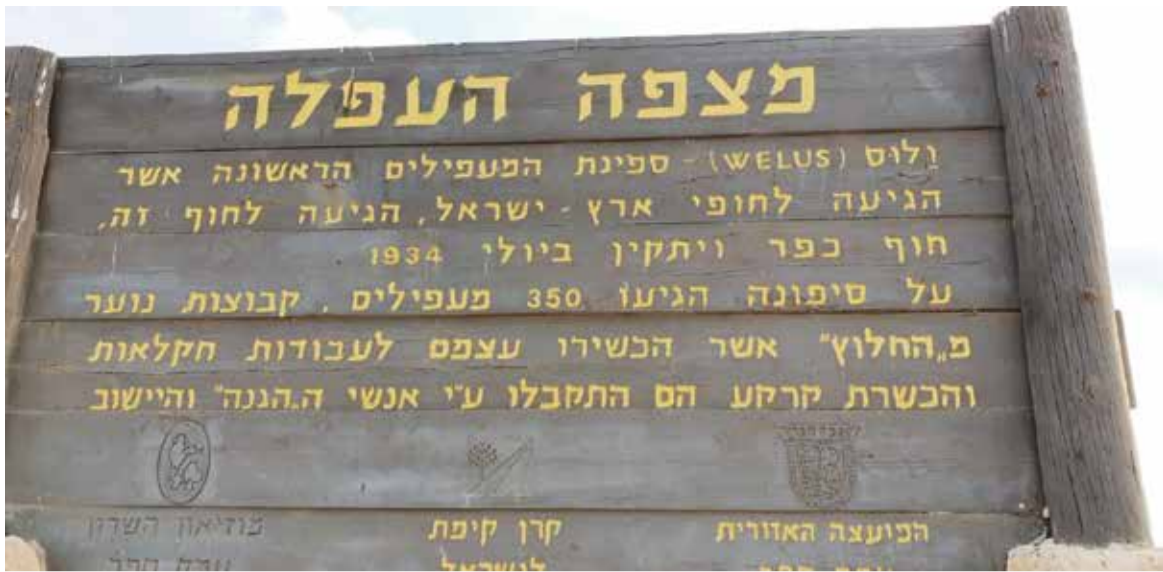
שלט מצפה העפלה