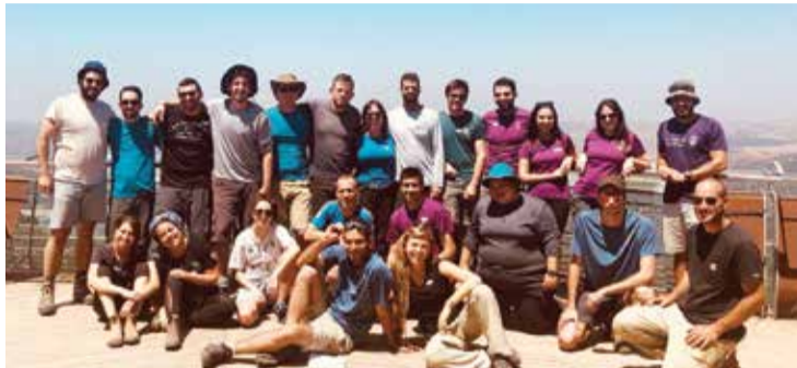
ההכנות למסע "דרך ארץ" 2019 - ההרשמה בשיא

ההרשמה למסע "דרך ארץ" 2019 נמצאת בשיאה, המסע יוצא לדרך בין ה-19.8.19-21 ועתידיים להשתתף בו מעל 200 בוגרי כיתות י"א