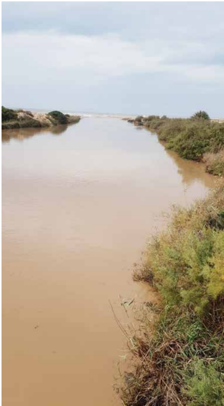
נחל אלכסנדר לאחר סערה, צבע המים חום מהסחף

בתקופה שלפני קום המדינה הגיעו עו ספינות מעפילים לחופי הארץ. החופים שנבחרו, היו חוף כפר וית