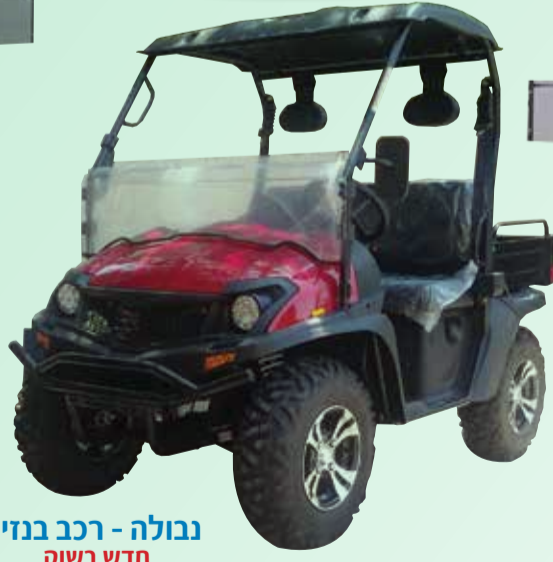
נבולה - רכב בנזין חדש בשוק