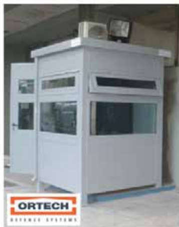
ביתן שומר ממוגן פלדה