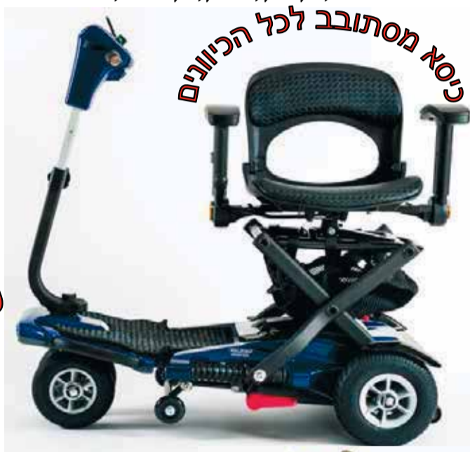
כיסא מסתובב לכל הכיוונים