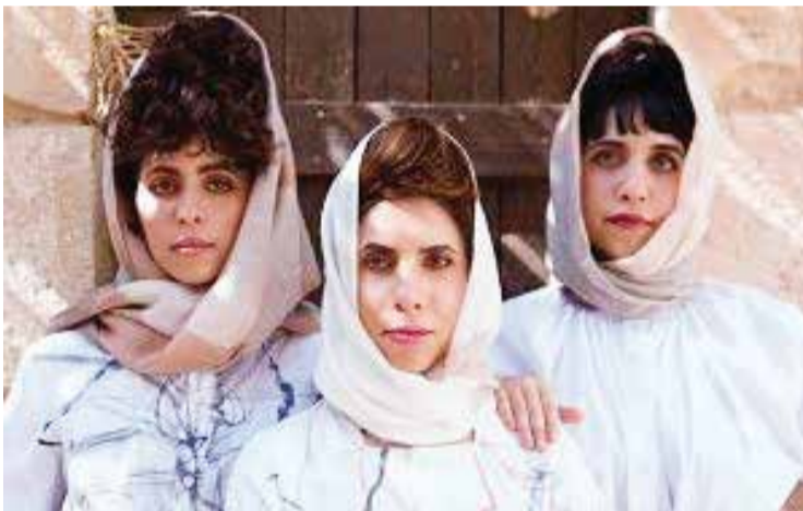
פסטיבל זרעי קיץ במגידו - חגיגה אזורית קהילתית