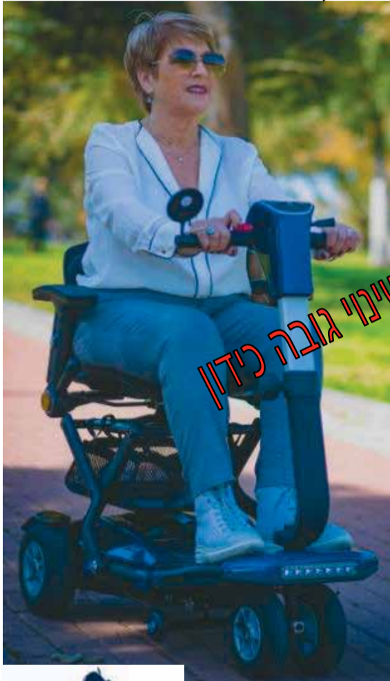
שינוי גובה כידון

4 גלגלי אוויר לנסיעה רכה + "אנטי טיפ" למניעת התהפכות, כיסא מסתובב 360 מעלות, גמישה מאוד במעברים צרים *מתקפלת חשמלית ע"י דוושה. *נכנסת מקופלת לרכב, רכבת, מטוס, שיט, מעלית, מחסן. *שלדת אלומיניום *איכסון עמידה/שכיבה. *נוחה לשימוש במרכול, קניון, בנק, קופ"ח, מוזיאונים, טיסה, טיולים *נידחפת כמזוודה.