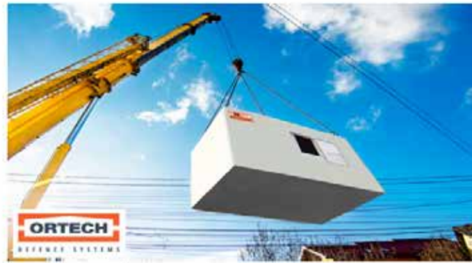
מיגונית, ממ"ד, ממ"מ - יביל