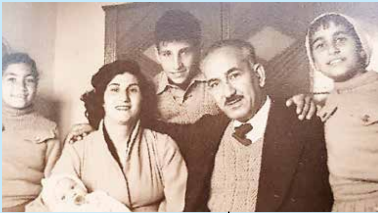
המשפחה בארץ, זמן קצר אחרי העלייה מעיראק