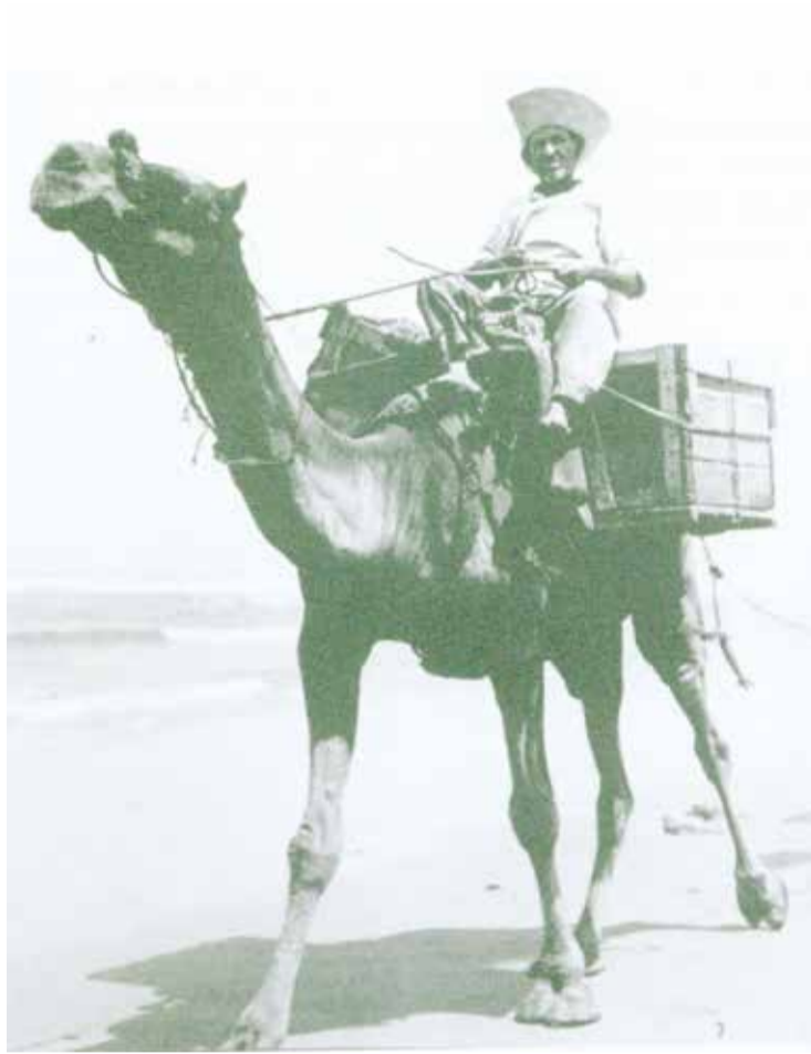
גמל מוביל זיפזיף בארגזים (1934, ארכיון כפר ויתקין)