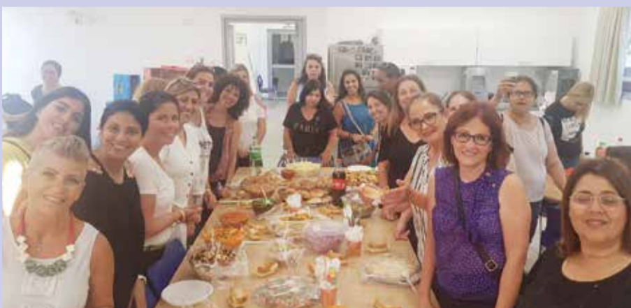
30 הסייעות מגן רווה בסיום הקורס