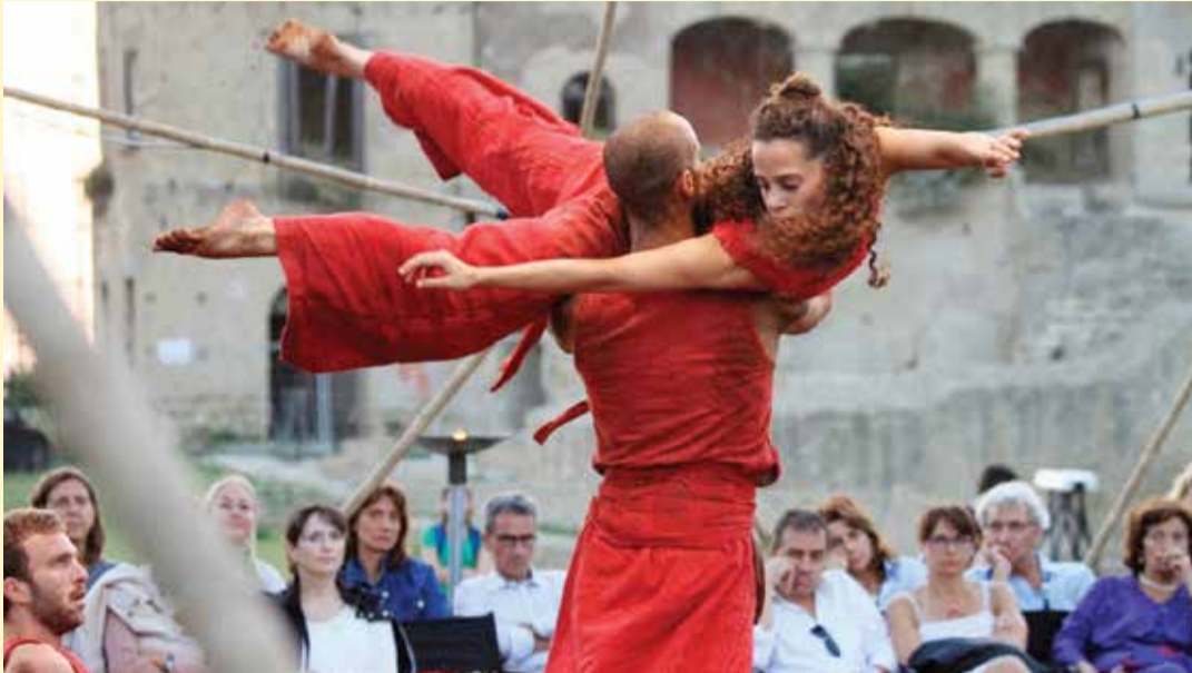
להקת המחול ורטיגו תופיע בעמק

לאומית להכשרת רקדנים, מרכז כח האיזון למחול משולב, ועוד. במופע "לידת הפניקס", שיועלה ב-27.8 בבית המועצה, הפניקס מת-