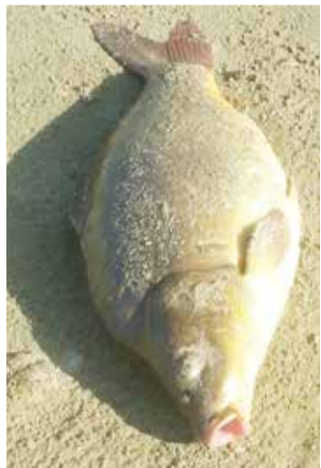
קרפיון שנחף מהנחל בסערה לים ונפלט מת לחוף

ערב אחד נסענו רכובים על גב הטרקטור 'שטייר' שלי, כדי למצוא בירור ('לחפש חתיכות'). בערב המדובר נפגשנו בכני הנוער של קיבוץ יגור. הם ישבו על יד מדורה, אכלו, שרו ובעיקר אכלו. והיו להם, תקשיבו טוב טוב, ארגזים עם תפוחי עץ ירוקים צהבהבים (זן דלישס,