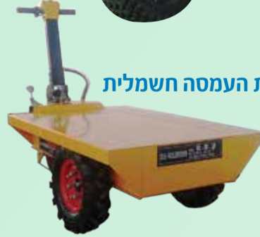
עגלת העמסה חשמלית