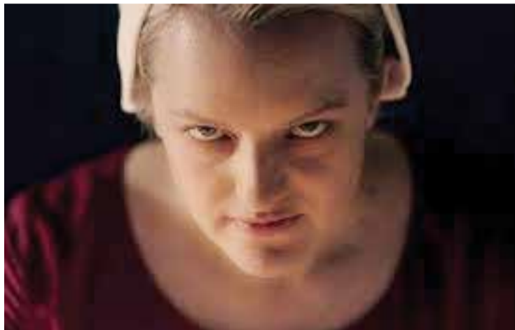
סיפורה של שפחה, עונה 3.

נראות התהומות אליהן שיכול להגיע המין האנושי, תחת מעטה של בימוי נהדר: מגיעה העונה השלישית, איטית יותר, מותחת פחות, אבל בהחלט נחו צה.